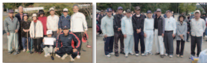
●一緒に楽しく回りました。 ●上位入賞者の皆さんです。

11月6日(火)好天に恵まれ約 140 名が参加して開催されました。ダイヤモンド賞(ホールインワン3回)が2名も出るハイレベルの大会でした。参加頂きました皆様ありがとうございました。次回は、5月の予定です。