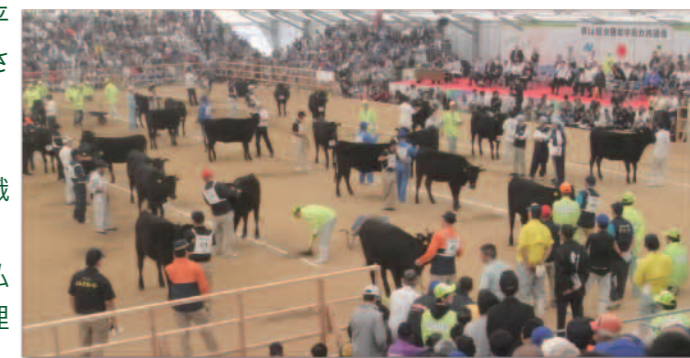
●「第10回全国和牛能力共進会」会場の様子

安い輸入肉の影響で苦しい経営状況にあります。私たち消費者が賢い目で、安心安全な環境で飼育管理された商品に目を向け、購入をしたいものです。