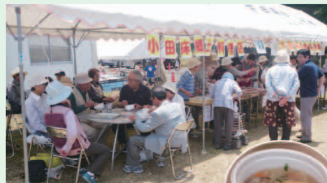
小田床の屋台(大変美味しかった)

天草の特産品や地元飲食店の屋台が並び、初めての開催にも関わらず、1,000人を超える参加者で一日中賑わい、メイン会場の下田南・小田床の人たちが熱く燃えていました。