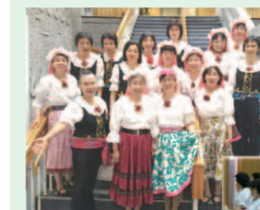
熊本支部の35周年事業に参加。市民会館崇城大学ホール(熊本市市民会館)にて

【本年度天草での活動予定】 日本フォークダンス連盟熊本県支部と天草市教育委員会の共催で、市内の小中学校の先生方への研修会の開催。(8月5日：天草市民センター) クリスマス「フォークダンスの集い」(12月14日予定：天草市民センター)