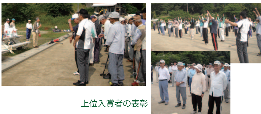
上位入賞者の表彰

6月14日(金) 梅雨の合間の好天に恵まれ、約 130 名が参加して開催されました。