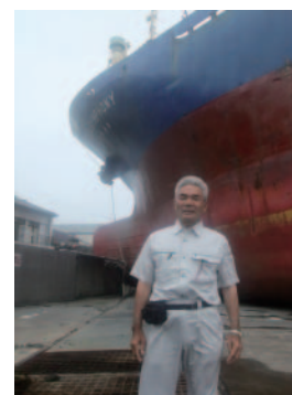
10,000t の大型タンカーが今も港に衝突したまま

今回、私は 7 月 19 日岩手県の陸前高田市・大船渡市・釜石市・宮古市などで、被災地現地確認及び支援活動に参加して参りましたのでご報告いたします。