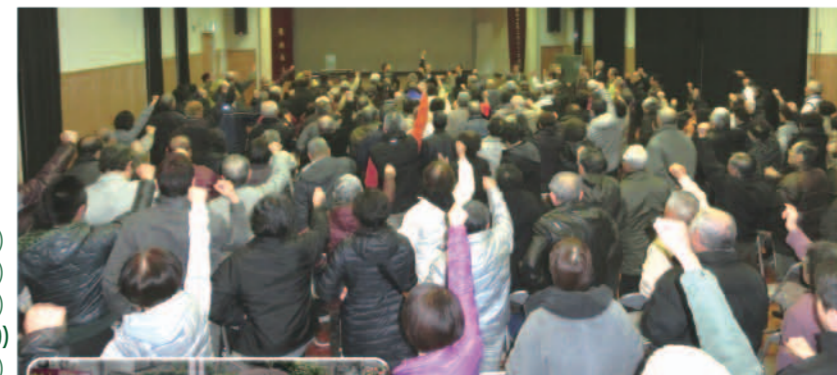
亀場コミュニティーセンターでの市政報告会