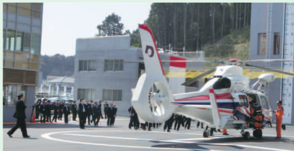
熊本県の防災ヘリ「ひばり号」落成式に参加

建設場所 (本渡町広瀬地内) 総工事費 19億8,121千円 【天草市負担額】 13億65,086千円 敷地面積 11,193.52㎡