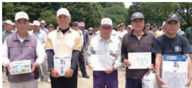
上位入賞者の皆さんです。(おめでとうございます)