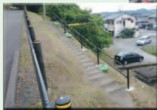
公園に登る 里道の安全対策