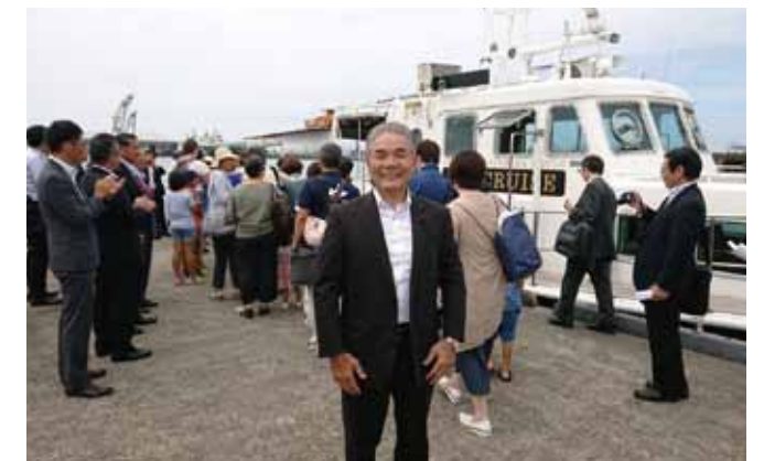
シークルーズ号(50人乗り)の出発式 (八代内港にて/8.20)

八代港へのクルーズ船の寄航で、増える外国人客を天草地域に短時間（30分）で運ぶ、観光航路実証事業がスタートしました。 クルーズ船寄航予定日に、1日4往復・片道1,000円で11月まで運行するそうです。 利用状況を見て、事業化（定期航路開設）を検討する取り組みが始まりました。