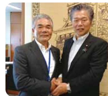
参議院会館で要望活動

また、2019年のラグビーワールドカップ、女子ハンドボール世界選手権大会を成功させ、熊本復興を全世界に発信すると共に、世界各国とつながり、国際的な認知度、高感度を向上させ、熊本県経済の飛躍的な発展に努めると、力強く述べられました。