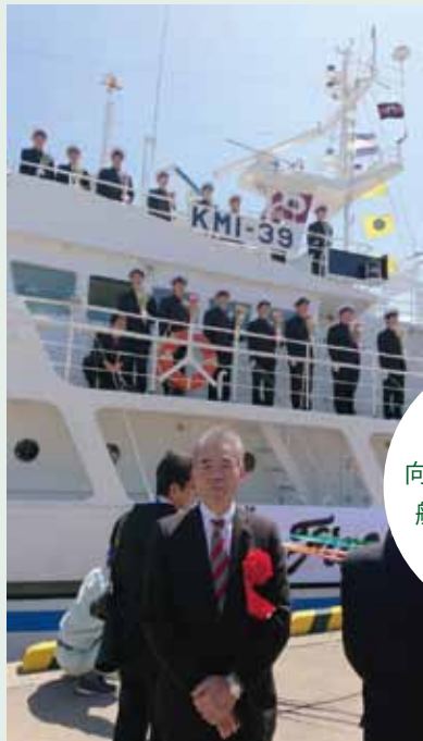
実習船「熊本丸」出発式にて