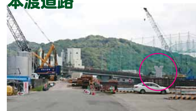
橋脚の一部も完成