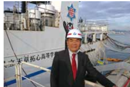
建造中の熊本丸視察(石巻市 /10.16)