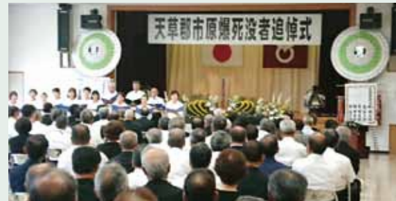
天草郡市原爆死没者追悼式(苓北町 /8.9)