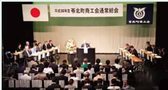
苓北町商工会総会(5.18)