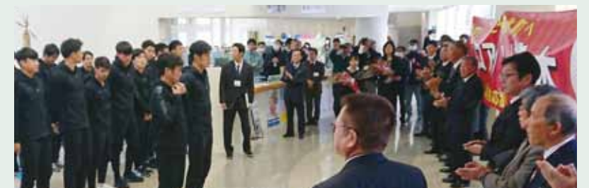
ロアツソ熊本 苓北町合宿歓迎会(苓北役場 /1.11)

1月 ロアツソ熊本トップチームが、1月11日～14日まで、苓北町にてキャンプを実施しました。 トレーニング会場 苓北町麟泉運動公園