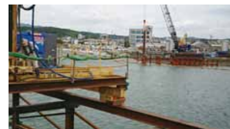
本渡港内の架橋下部工現場