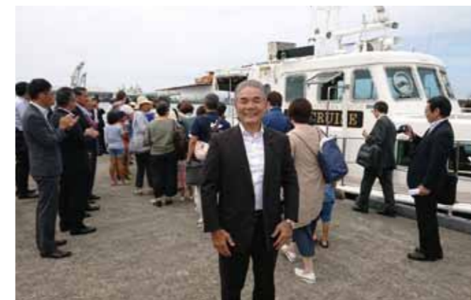
シークルーズ号(50人乗り)の出発式（八代内港にて/8.20）