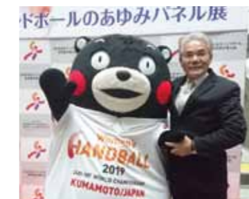
女子ハンドボール世界選手権PRイベント 2017