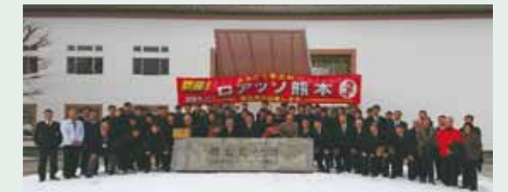
ロアツソ熊本 茶北町合宿歓迎会(茶北役場前 /1.11)