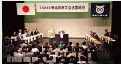
苓北町商工会総会(5.18)