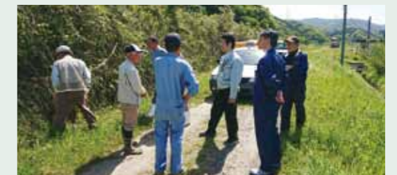
楠浦地区河川管理道路整備打合せ(4.20)