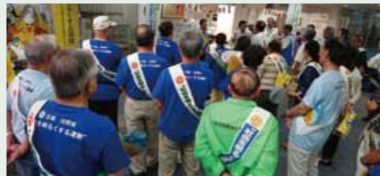
社会を明るくする運動(7.14)