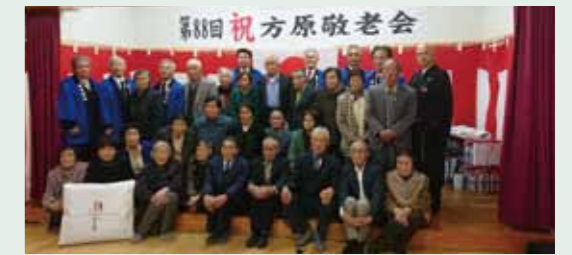
第88回 楠浦町方原敬老会(1.7)