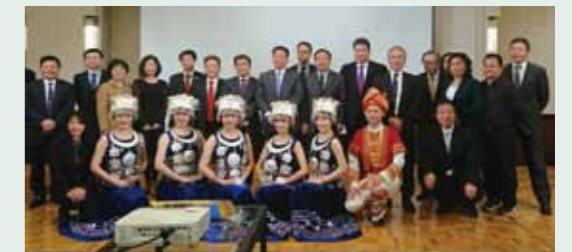
日中経済観光交流会in熊本(3.23)