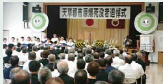
天草郡市原爆死没者追悼式(苓北町/8.9)