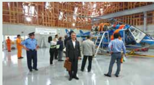
教育警察常任委員会 熊本県総合防災航空センター(菊陽町)視察