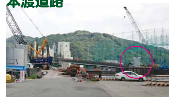
橋脚の一部も完成