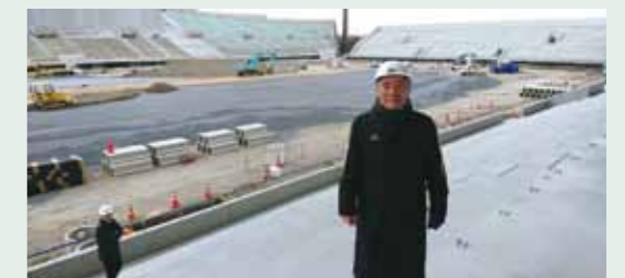
国際スポーツ推進特別委員会の視察(埼玉 /2.1)