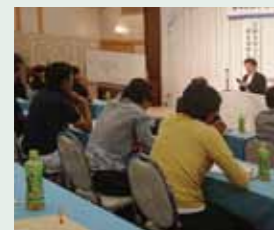
熊本県海水養殖漁業協同組合総会(6.22)