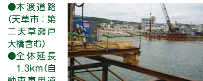
本渡港内の架橋下部工現場