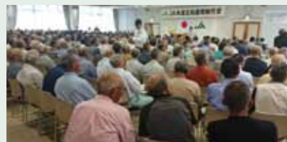
JA 本渡五和農業協同組合総代会(6.23)